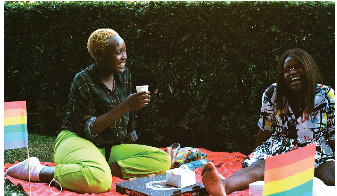
"Ei voi edes sanoin kuvaila."