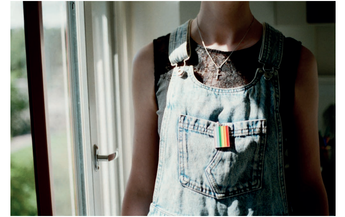
"Stand to face me beloved and open out the grace of your eyes" - Sappho, fragment 138, trans. Anne Carson