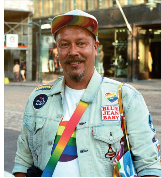
"Ei mitään parempaa."